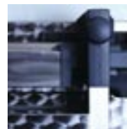
GF-8 Verzinkt/Edelstahl bis 120 kg Blatt- gewicht