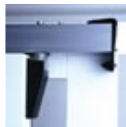
GF-5 / 6 Aluprofil bis 80 kg bis 120 kg