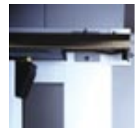
GF-3 Verzinkt/Edelstahl bis 200 kg